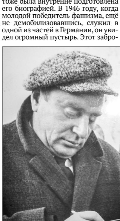
В кругу читателей.

Герману Хорсту отведено самое большое место в поэме. По мысли автора, именно он — главный виновник бед, обрушившихся на человечество. Что мог бы сделать Гитлер без Германа Хорста? Но верно и другое: Герман Хорст — создатель Гитлера. «Он не такой, чтоб рассуждать...» Для него свинец, война — работа. Война кормит. Но что-то мало-помалу начинает