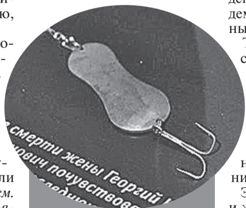
Самодельная блесна, которую подарил журналисту «Комсомолки» Георгий Константинович Жуков.

Низкий поклон всем, кто помог совершить доброе дело. Именно так, как учил нас Песков.