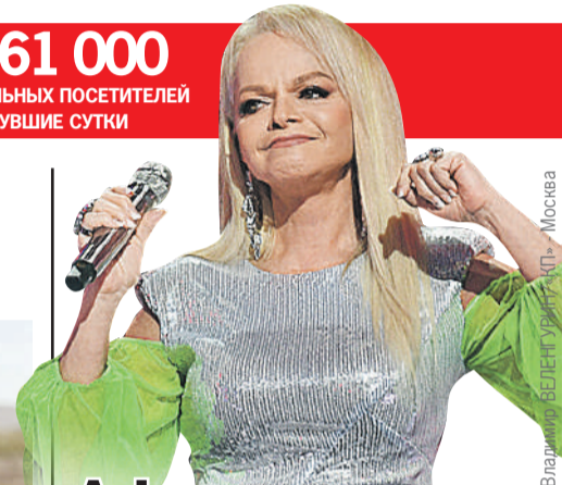
Владимир БЕЛЕНКО/ИТАР-ТАСС - Москва