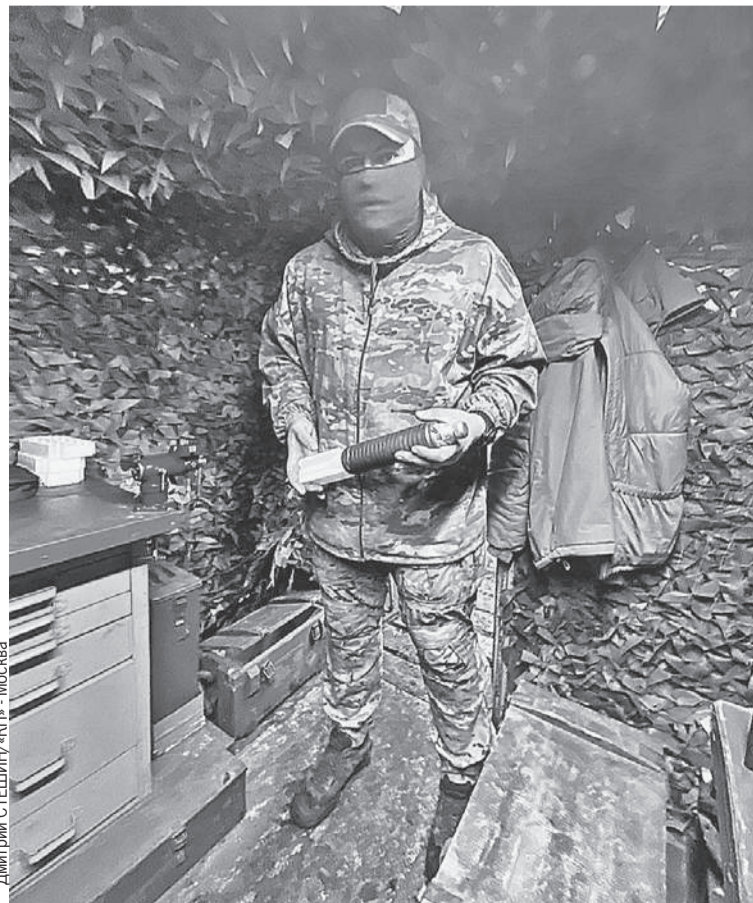
Сапер «Вайджа» работает не только со «штатными» боеприпасами для БПЛА, но и с новинками.

- Когда ты можешь работать столько, сколько есть целей. И не переживаешь,