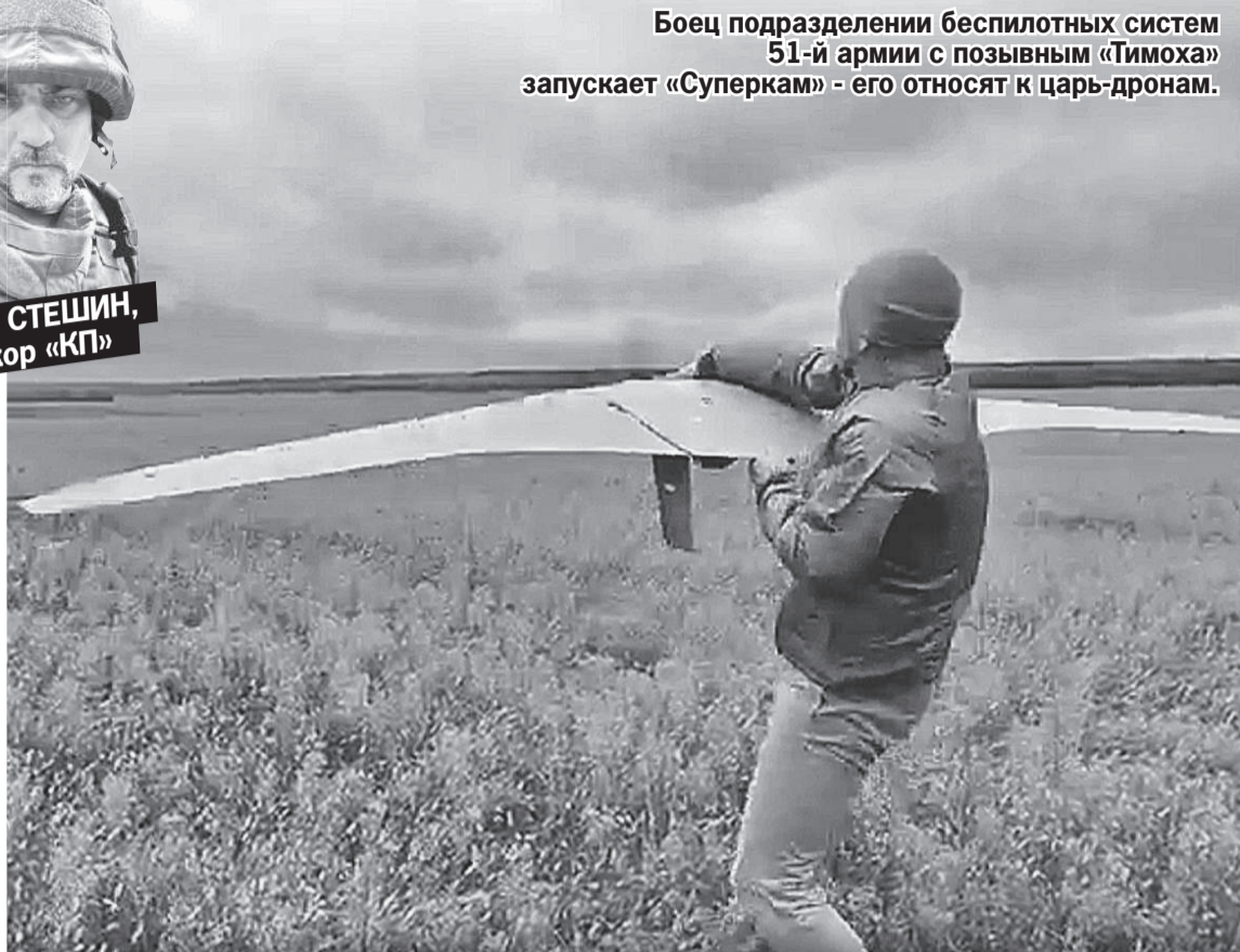
Боец подразделения беспилотных систем 51-й армии с позывным «Тимоха» запускает «Суперкам» - его относят к царь-дронам.