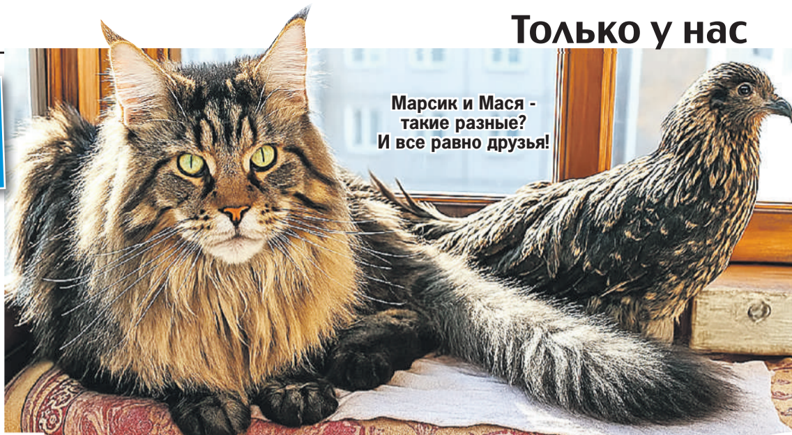
Марсик и Мася - такие разные? И все равно друзья!

- Думал, что это сокол. Но что с ним делать? Звоню