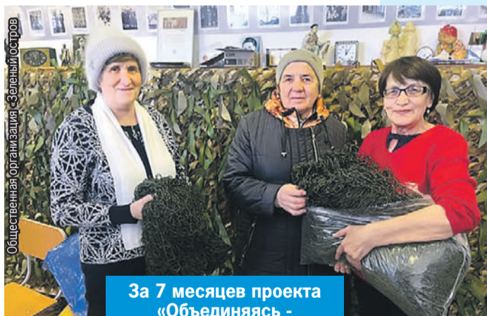
Общественная организация «Зеленый остров»