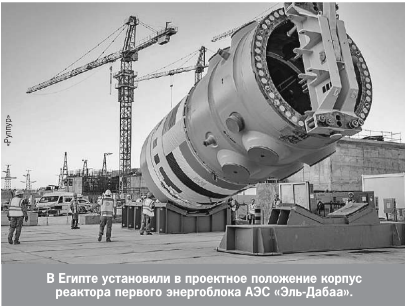
В Египте установили в проектное положение корпус реактора первого энергоблока АЭС «Эль-Дабаа».

Четыре атомных ледокола одновременно строятся сегодня в России - даже в советские времена такого не было! Все наши атомные ледоколы эксплуатирует госпредприятие «Росатомфлот», которое входит в состав «Росатома». Который, в свою очередь, является инфраструктурным