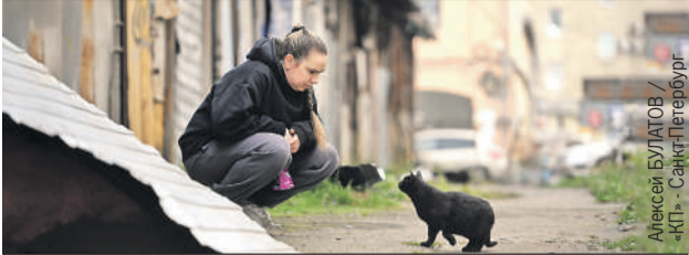
Алексей БУЛАТОВ / «КП» - Санкт-Петербург

Наши (да и не наши тоже) люди любят кошек и часто подкармливают бездомных пушистиков. Но у некоторых «забота» переходит все границы, тогда страдают все: и люди, и сами животные.