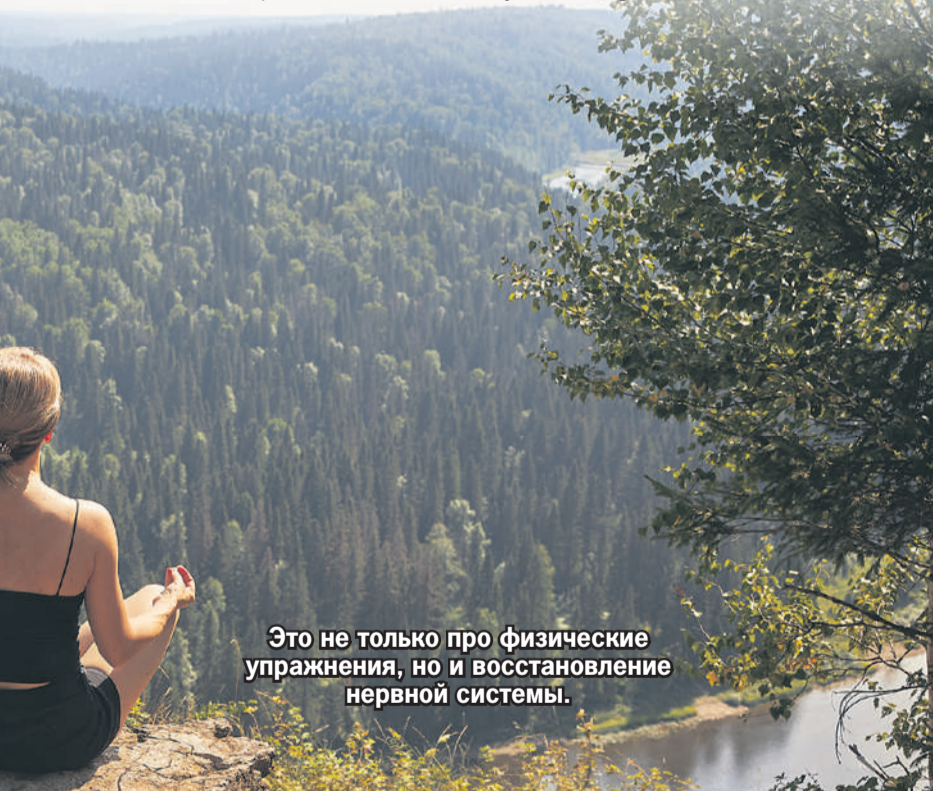
Это не только про физические упражнения, но и восстановление нервной системы.

- Самый большой миф о йоге, это что для нее нужно быть уже гибким. Это тоже самое, что не идти в тренажерный зал, потому что у тебя нет накаченных мышц. Тело меняется, когда вы начинаете им заниматься, а не до. Поэтому первый шаг - просто принять себя таким, какой вы есть. Я всегда говорю ученикам: не сравнивайте себя с другими. Только с самим собой - каким вы были вчера и есть сегодня. Месяц назад дотянулись до колена, а сейчас уже до голени? Это прогресс! У кого-то в зале получается лучше? Значит, это его путь. У вас свой. Стоит прийти и попробовать. Без ожиданий, без плана стать супергибким через какое-то время. Просто подышать, почувствовать свое тело. И еще: никто не смотрит на вас в зале, честно, все занято собой. Так что, если вы чувствуете себя «деревом» - приходите таким. Йога как раз для деревьев. Со временем вы удивитесь, как много листьев на нем распустилось, и какие крепкие у него корни.