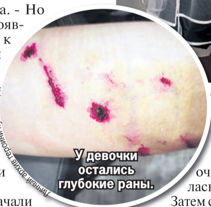
У девочки остались глубокие раны.

Подростку прописали курс уколов от бешенства.