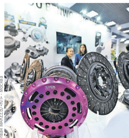
Иван МАКЕЕВ/«КП» - Москва