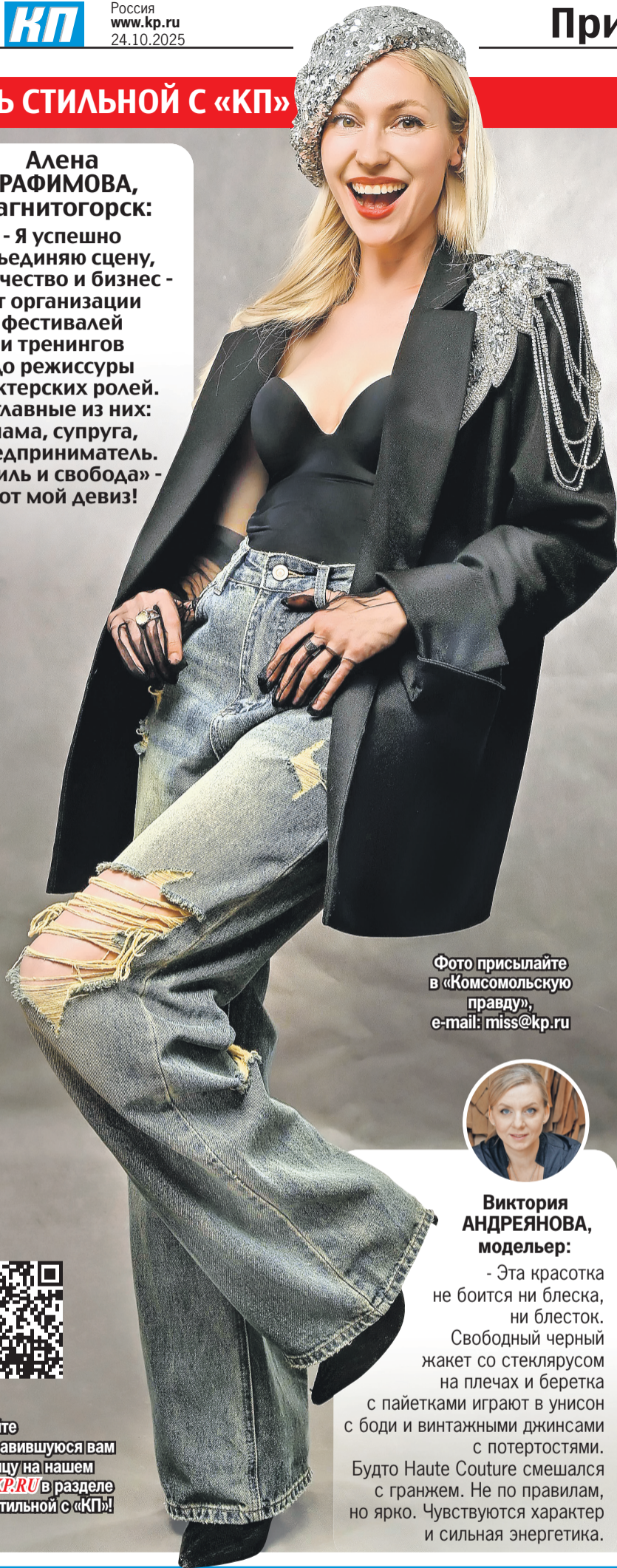
Фото присылайте в «Комсомольскую правду», e-mail: miss@kp.ru

- Я успешно объединяю сцену, творчество и бизнес - от организации фестивалей и тренингов до режиссуры и актерских ролей. А главные из них: мама, супруга, предприниматель. «Стиль и свобода» - вот мой девиз!