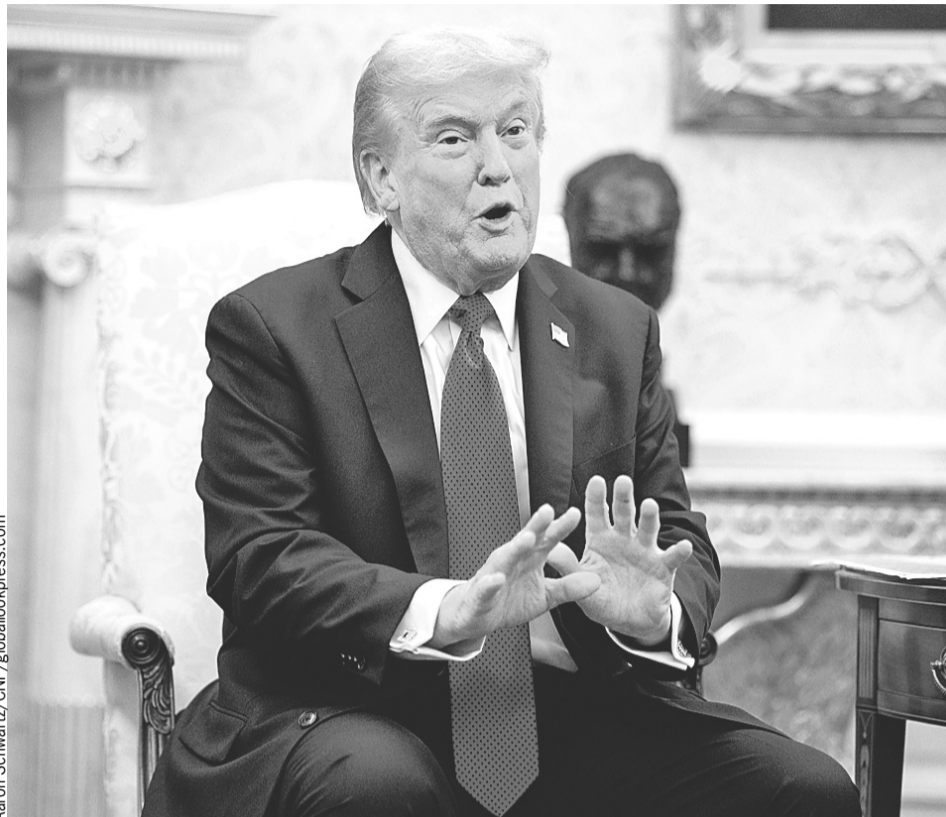
Такой противоречивый весь: введя санкции, Дональд заявил, что не уверен в их эффекте.