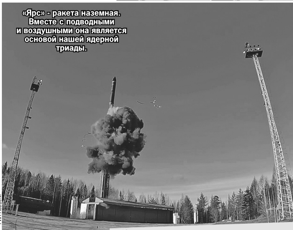
«Ярс» - ракета наземная. Вместе с подводными и воздушными она является основой нашей ядерной триады.

После этого были запущены ракеты со всех платформ ядерной триады: с земли, из-под воды и с самолетов. Естественно, боевого оснащения на них не было.