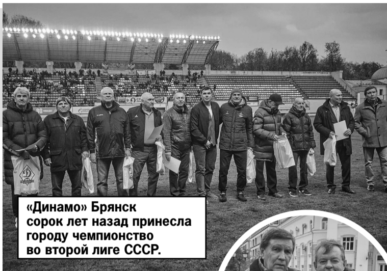
«Динамо» Брянск сорок лет назад принесло городу чемпионство во второй лиге СССР.

За это бурное десятилетие динамовцы стали чемпионами РСФСР 1989 года, дважды бронзовыми призерами – в 1985 и 1988 годах. А в 1985 году, в год 1000-летия Брянска, команда преподнесла городу самый большой подарок – выиграла зонального первенства СССР во 2-й лиге!