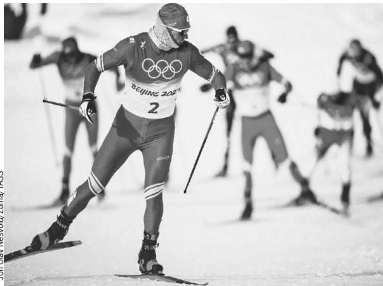
Александр Большунов на Олимпиаде-2022 в Пекине не оставил соперникам ни единого шанса на победу.

- В том числе. Они за политическими мотивами завуалировали недобросовестную спортивную конкуренцию, понимая, что такие, как Саша, могут их обыграть. А они уже привыкли за последние три года разыгрывать медали между собой. Медали для них не пахнут. Для спортсменов, может быть, хотелось бы конкуренции, но чиновники и спонсоры прекрасно себя чувствуют, когда выигрывают только их спортсмены.