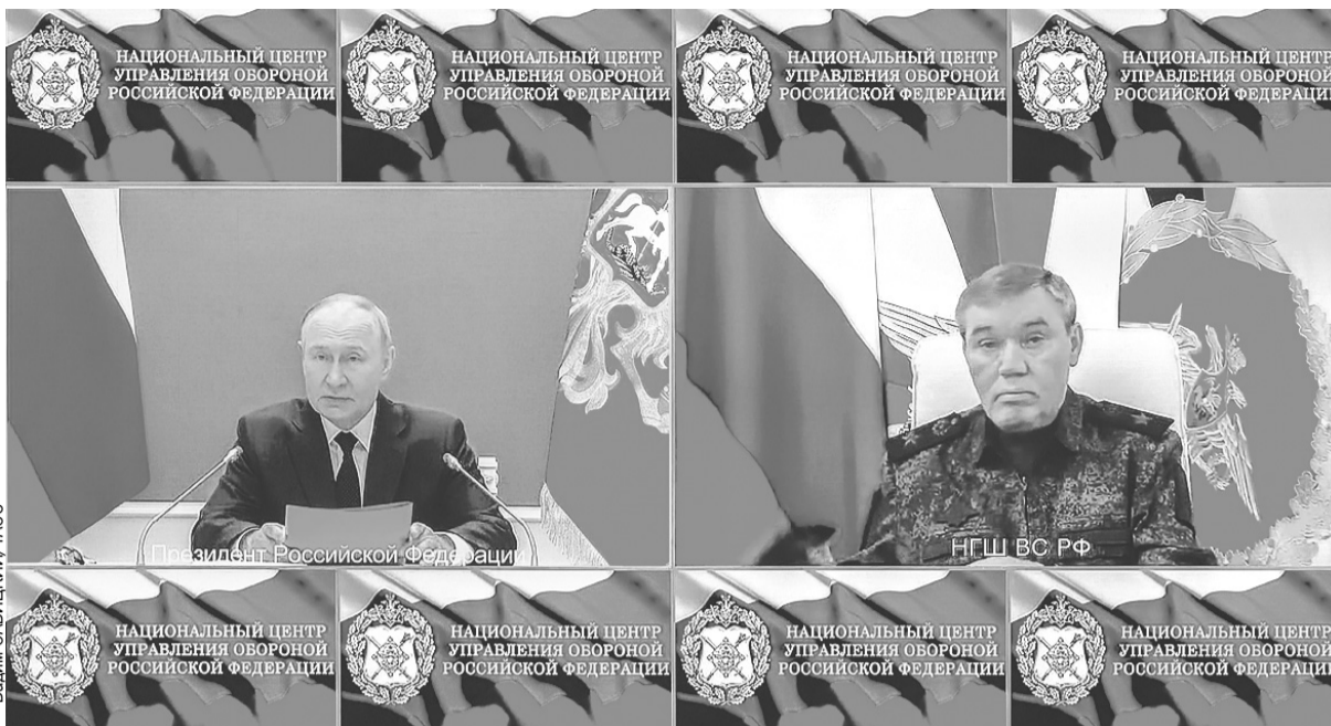
Доклаживал президенту о проведении тренировки начальник Генерального штаба Валерий Герасимов.

- На тренировке проверены уровень подготовки органов военного управления, практические навыки работы оперативного состава по организации управления подчиненными войсками. Все задачи тренировки выполнены, - заявили в Минобороны.